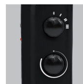
Ручка управления и термостат.