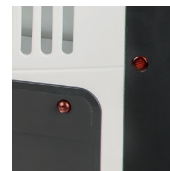
Световой индикатор работы.