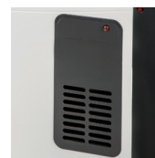
Принудительное движение воздуха TLS-503T.